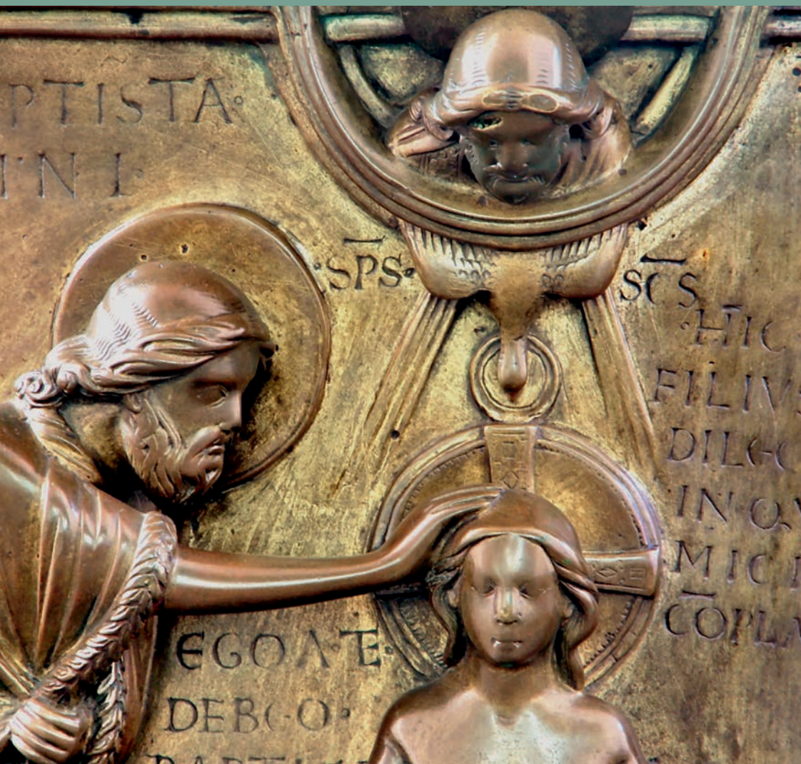
Le Père, le Fils et l'Esprit avec Jean-Baptiste