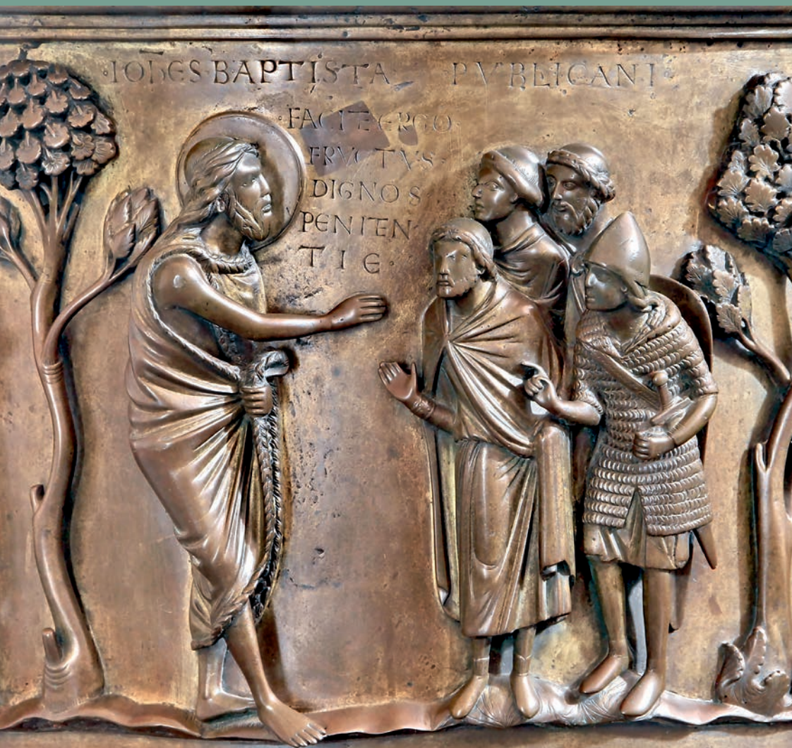
Prédication par Jean-Baptiste