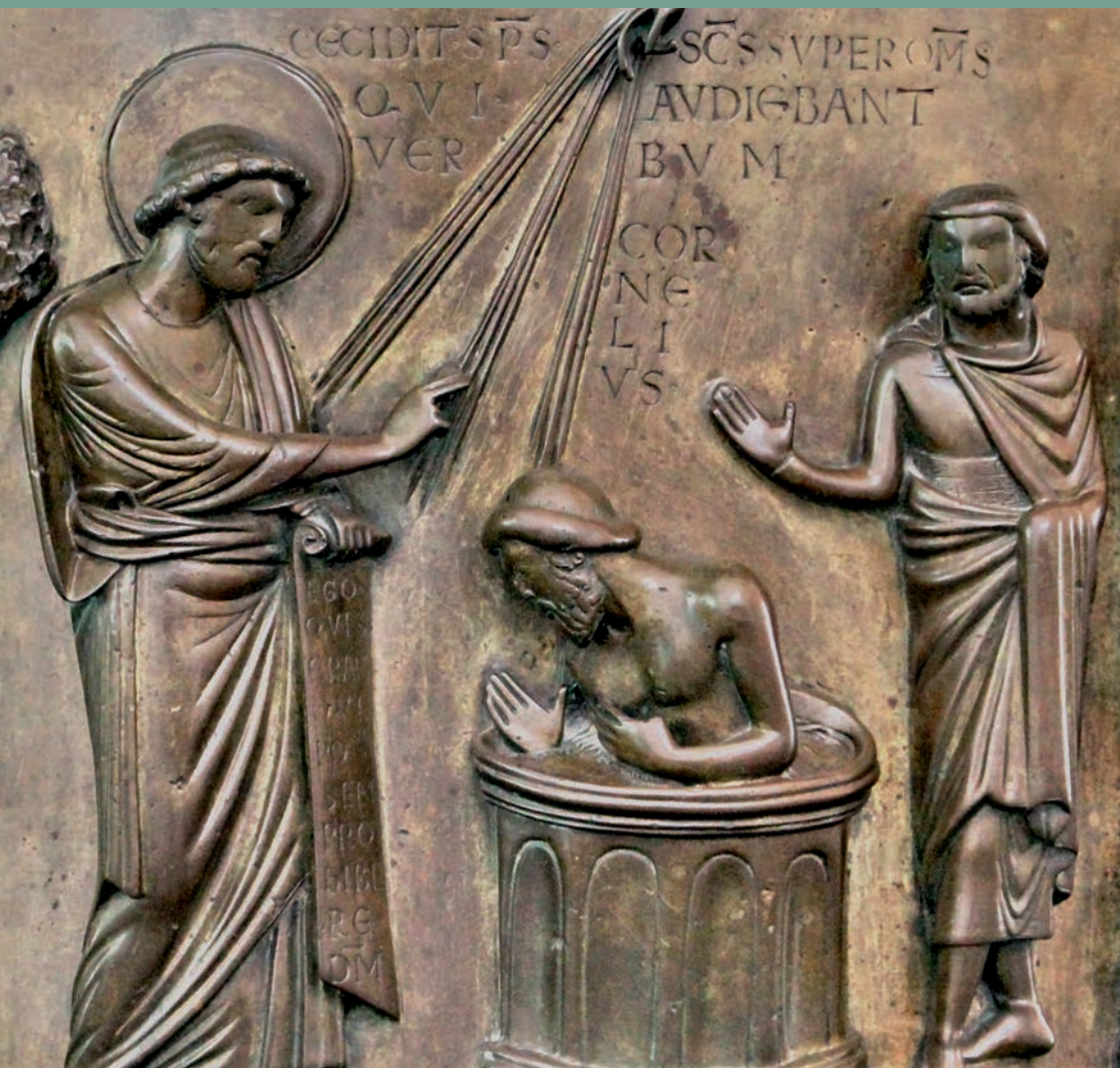
Pierre baptise Cornélius, le Centurion païen (cf. Ac 10)