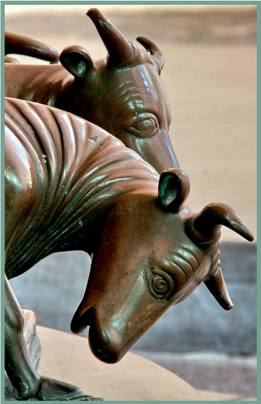
Les fonts baptismaux reposent sur douze bœufs solides (cf. 2 Ch 4,4)