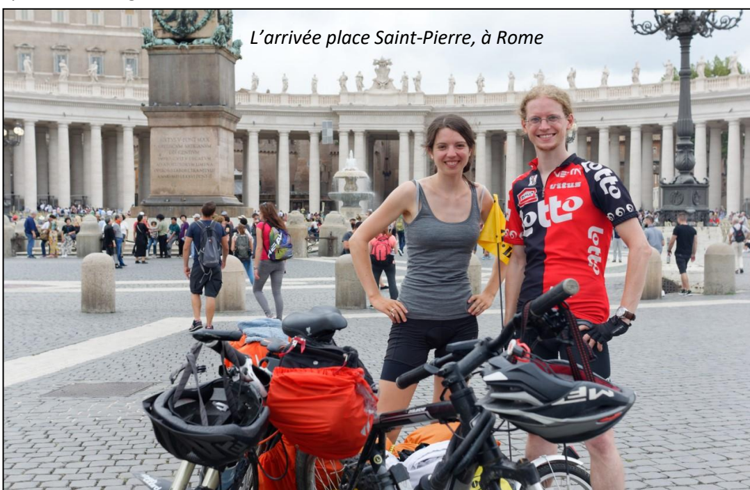
L'arrivée place Saint-Pierre, à Rome

Avec ce voyage, on a goûté avec délice au plaisir d'une liberté limitée seulement par notre capacité musculaire. Rien n'était planifié. On campait la plupart du temps et le plaisir simple de prendre une douche le soir nous suffisait ; pour se nourrir, on trouvait facilement des fruits et légumes, des petites boucheries-fromageries ou des magasins de vrac. S'il pleuvait, on s'abritait. S'il faisait trop chaud ou qu'on était fatigués, on faisait une pause. Ce sentiment de liberté, c'était si bon !