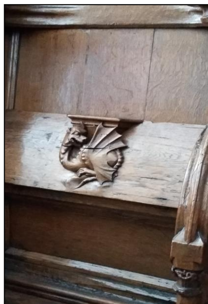
Miséricorde d'une stalle de la cathédrale de 's-Hertogenbosch (P-B)